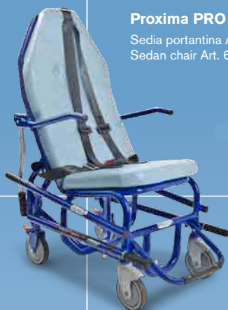
Proxima PRO Sedia portantina Art. 683 Sedan chair Art. 683

Guarda il video on-line Watch on-line video