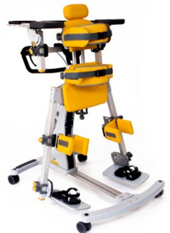
Nota: l'illustrazione non corrisponde alla configurazione di base

Attenzione! I codici ISO sono indicativi e soggetti ad approvazione del medico prescrittore